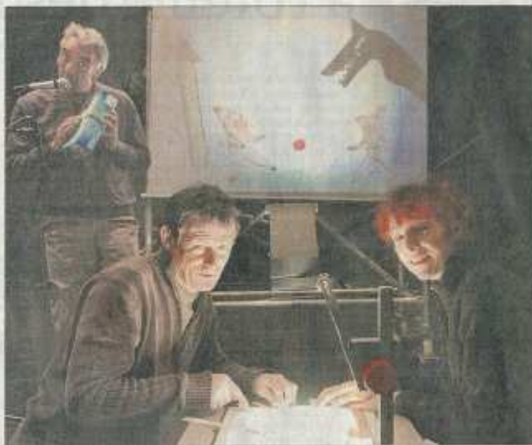
■ Les deux petits cochons ont une sœur...